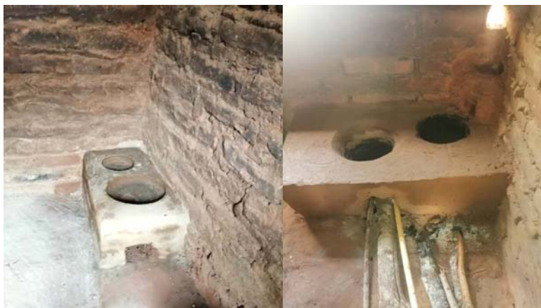
Mfano wa majiko banifu yaliyotengenezwa katika kaya za wilaya za Nyasa na Mbinga

67. Mheshimiwa Spika , katika kipindi cha mwaka 2020/21 Ofisi imeendelea kuratibu utekelezaji Mradi wa Usimamizi Endelevu wa Ardhi ya Bonde la Ziwa Nyasa ambapo kiasi cha shilingi 230,165,952.84 kilitumika. Kazi zilizotekelezwa ni pamoja na: kuendesha mafunzo kuhusu matumizi ya majiko banifu kwa kaya 40 na kuwezesha utengenezaji wa majiko banifu 96 katika wilaya za Nyasa na Mbinga; kuelimisha vijiji 26 kuhusu uanzishaji na uimarishaji wa jumuiya za watumia maji katika Bonde la Ziwa Nyasa katika Halmashauri za Wilaya ya Mbinga Vijiji ( 16 ) na Nyasa (Vijiji 10); na kufanya utafiti wa shughuli mbadala za kujiongezea kipato kwa vijiji vitatu ( 3 ) kwa kila halmashauri za wilaya tano (5) za Nyasa, Mbinga, Kyela, Ludewa na Makete.