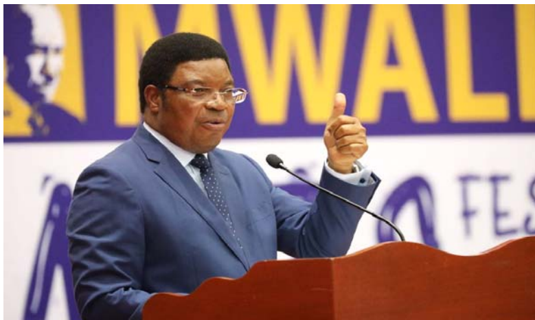
Waziri Mkuu wa Jamhuri ya Muungano wa Tanzania, Mhe. Kassim Majaliwa Majaliwa

8. Mheshimiwa Spika , ninamshukuru na kumpongeza Mheshimiwa Kassim MajaliwaMajaliwa (Mb.) , Waziri Mkuuwa Jamhuri ya Muungano wa Tanzania, kwa hotuba yake nzuri ambayo imetoa mwelekeo wa kisera katika utekelezaji wa shughuli za Serikali kwa kipindi cha mwaka 2021/22. Aidha, ninampongeza kwa uongozi wake thabiti katika kusimamia shughuli za Serikali ndani na nje ya Bunge lako Tukufu. Vilevile, ninawashukuru Waheshimiwa Mawaziri wote kwa ushirikiano walionipa katika kutekeleza majukumu ya kusimamia shughuli za Muungano na Mazingira.