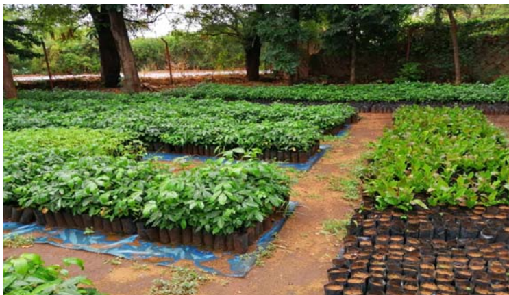
Moja ya Kitalu cha miche 114,416 katika wilaya ya Mvomero

65. Mheshimiwa Spika , katika kipindi cha mwaka 2020/21, Ofisi iliendelea kutekeleza Mradi wa Kuhimili Mabadiliko ya Tabianchi Kupitia Mifumo ya Ikolojia ambapo kiasi cha shilingi 1,380,000,000 kilitumika. Kazi zilizotekelezwa ni Pamoja na: kuandaa mfumo wa kielektroniki wa usimamizi wa taarifa na elimu kuhusu kukabiliana mabadiliko ya tabianchi; kuandaa mipango ya matumizi ya ardhi katika vijiji 14 katika wilaya za Simanjiro, Kishapu, Mpwapwa na Mvomero nakuanzisha vitalu vya miche 114,416 katika wilaya za Mvomero (miche 40,000), Simanjiro (miche 45,416), Kishapu (miche 3,000), na Mpwapwa (miche 26,000).