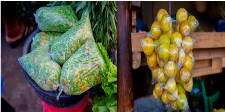
Pichani: Vifungashio vilivyobadilishwa matumizi na kutumika kama vibebeo vya bidhaa kinyume cha sheria.

51. Mheshimiwa Spika , Katazo la matumizi ya mifuko ya plastikilimeibua changamoto mpya ambapo vifungashio vya plastiki vimeanza kutumika kama vibebeo na hivyo kuchangia kuongezeka kwa uchafuzi wa mazingira. Aidha, kumekuwepo na changamoto ya matumizi ya vifungashio vya plastiki visivyokidhi viwango vya ubora. Katika kukabiliana na changamoto hizi Serikali lilitoa tamko la kusitisha matumizi ya vifungashio vya plastiki kama vibebeo vya bidhaa; na kutoa kipindi cha mpito cha miezi mitatu kuanzia tarehe 8 Januari 2021 kuviondoa sokoni vifungashio vya plastiki visivyokidhi viwango vya ubora.