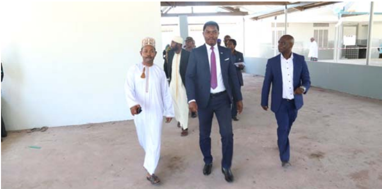
Waziri wa Nchi, Ofisi ya Makamu wa Rais (Muungano na Mazingira), Mhe. Selemani Jafo akikagua Mradi wa Udhubiti Uvuvi na Maendeleo Shirikishi Kusini Magharibi ya Bahari ya Hindi (South West Indian Ocean Fisheries Governance and Shared Growth - SWIOFish) katika eneo la Nungwi, Zanzibar

29. Mheshimiwa Spika , Mradi wa Udhubiti Uvuvi na Maendeleo Shirikishi Kusini Magharibi mwa Bahari ya Hindi ( SWIOFish ) unatekelezwa katika maeneo ya Pwani ya Bahari ya Hindi kwa upande wa Tanzania Bara na katika Wilaya zote za Zanzibar pamoja na Ukanda wa Uchumi wa Bahari Kuu ( EEZ ) kwa kipindi cha 2005 - 2021. Lengo kuu la mradi huu ni kuimarisha usimamizi madhubuti wa uvuvi katika ngazi ya kikanda, kitaifa na kijamii. Mradi unafadhiliwa na Benki ya Dunia kupitia mkopo nafuu wa Dola za Marekani 36,000,000.00 kwa mgawanyo ufuatao:- Wizara ya Mifugo na Uvuvi (SMT) Dola za Marekani 17,280,000.00 ; Wizara ya Kilimo, Maliasili, Mifugo na Uvuvi (SMZ) Dola za Marekani 11,520,000.00 ; na Mamlaka ya Uvuvi wa Bahari Kuu Dola za Marekani 7,200,000.00 .